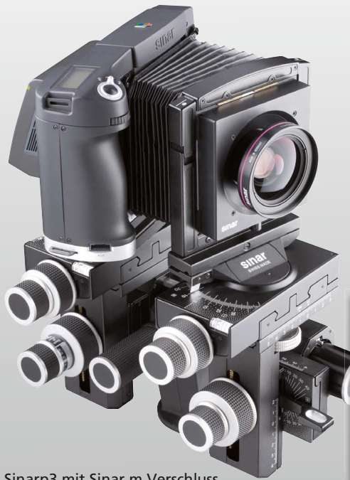
Sinar p3 mit Sinar m Verschluss