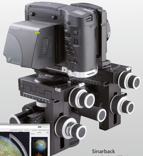
Sinarback eVolution 75 H