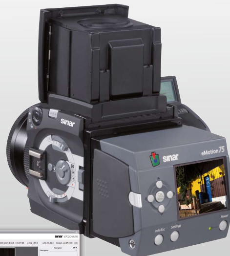
Sinarback eMotion 75 LV