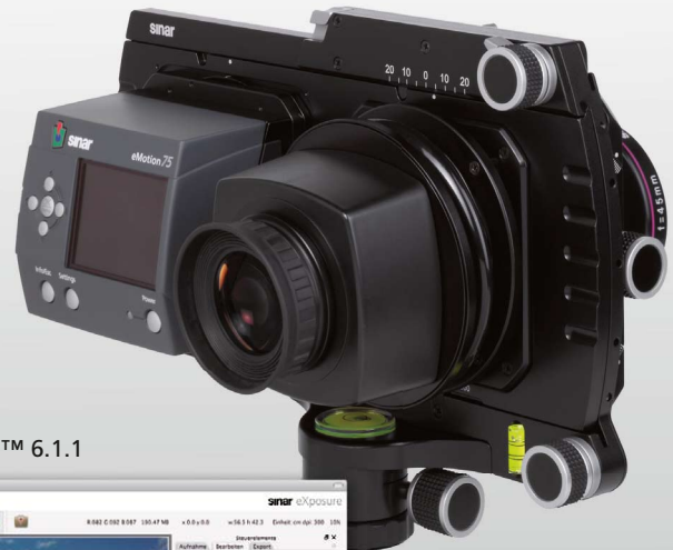
Sinarback eMotion 75 LV